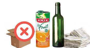
Carton, verre, papier