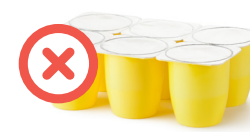
Pots de yaourt en plastique