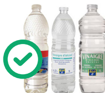
Bouteilles de vinaigre blanc transparentes