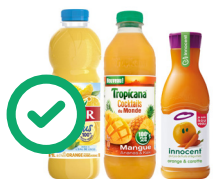
Bouteilles de jus de fruits transparentes