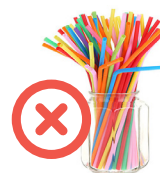
Pailles en plastique