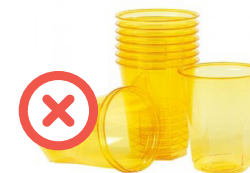
Gobelets, couverts, assiettes et barquettes en plastique