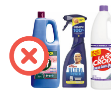
Emballages de produits ménagers opaques