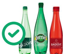
Bouteilles d'eau colorées et vides