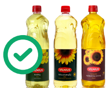
Bouteilles d'huile transparentes