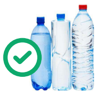
Bouteilles d'eau transparentes et vides