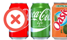
Canettes en acier / aluminium