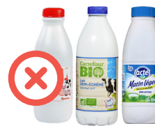
Bouteilles de lait opaques