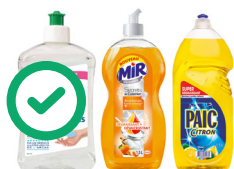
Flacons de liquide vaisselle transparents