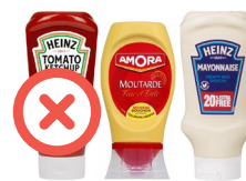
Flacons de sauce opaques