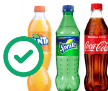
Bouteilles de soda transparentes